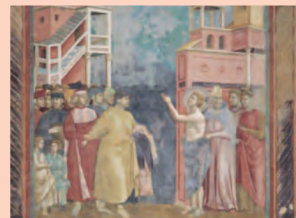
Giotto, La rinuncia ai beni paterni , dalle Storie di san Francesco , 1290-95.

Che l'esempio di San Francesco ci ricordi che nessuna ricchezza materiale potrà mai uguagliare la luminosità di un gesto d'amore, di un atto di solidarietà, di una mano tesa verso chi ha bisogno. E che questo esempio sia per tutti noi un invito a vivere con più semplicità e con più cuore.