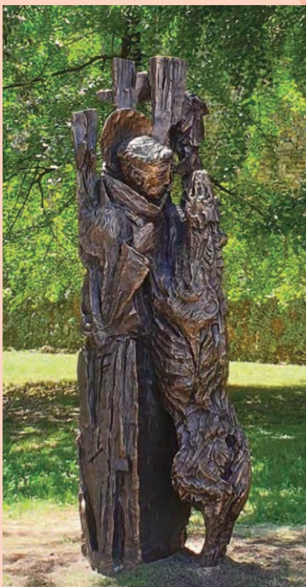
Opera di Luigi Carron "San Francesco e il lupo"

Lu santo jullare Francesco -opera teatrale di Dario Fo (1999)