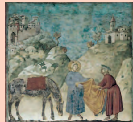
Giotto, Il dono del mantello , dalle Storie di san Francesco , 1290-95

La rinuncia ai beni paterni è una scena di grande libertà espressiva, che ricorda un momento fondamentale della vita del santo